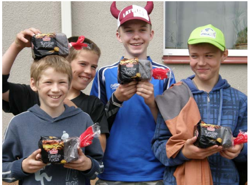
Jautrišu komanda.

Hanza lielu maizi cepa Garšīgu un pūkainu! Visi labi ļautiņi Hanzas maizi lielīja Hanza lielu maizi cepa Garšīgu un saldu Patīk lieliem, patīk maziem, Hanzas saldās maizītes!