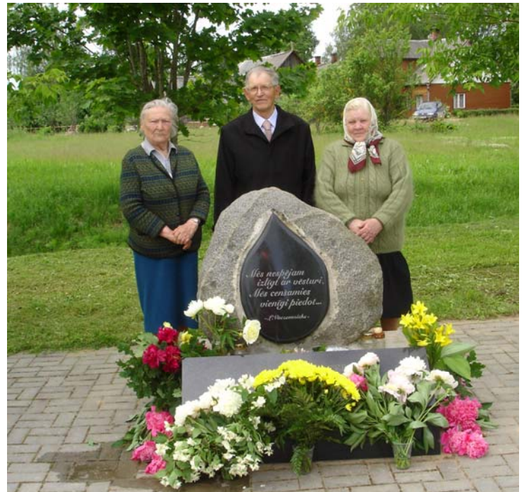
Atceres brīdī pie piemiņas akmens Rugājos.