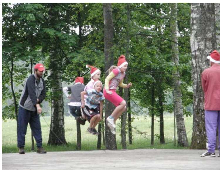
Sporta dienas aktivitātes