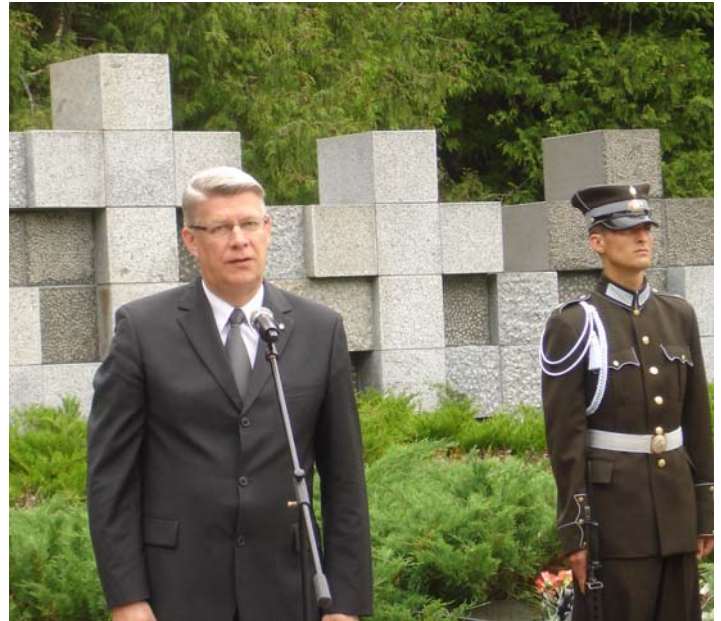
Latvijas valsts prezidenta uzruna.

Ja Jums mājās ir veci darbarīki, fotogrāfijas, dokumenti vai kāda cita interesanta sena lieta, kas pašam vairs tā īsti neiederās, nesiet tās uz muzeju, kopā savāktais un sakrātais būs jo interesantāks! Veidosim visi kopā savu muzeju, lai novadā ir vieta, kur koncentrējas mūsu pagastu, sadzīves, skolu, māju u. c. vēsture!