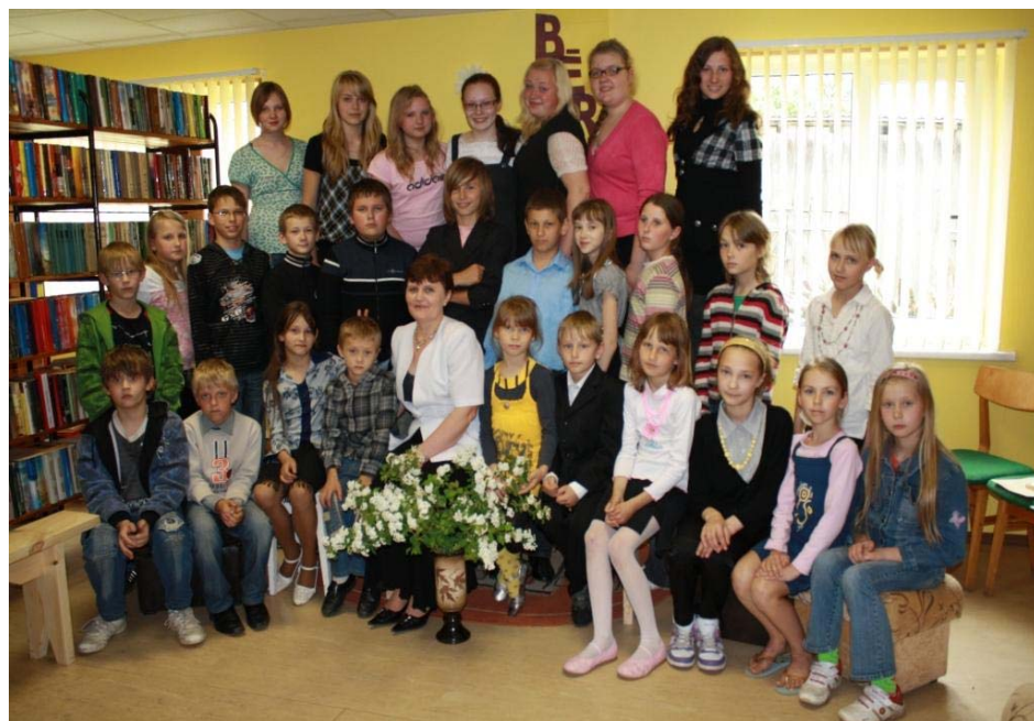
Bērnu žūrijas dalībnieki.